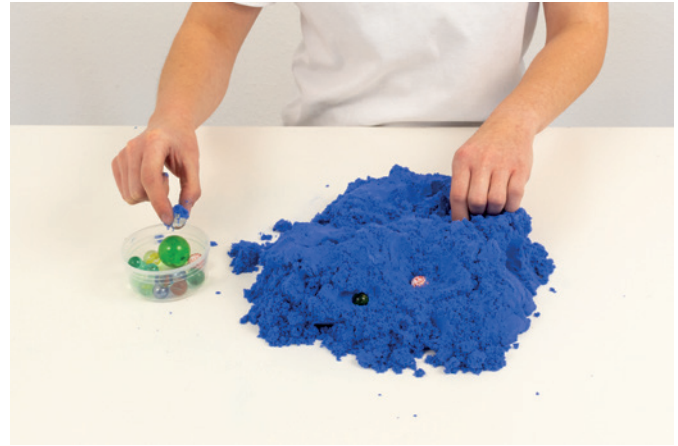
Murmeln finden 02