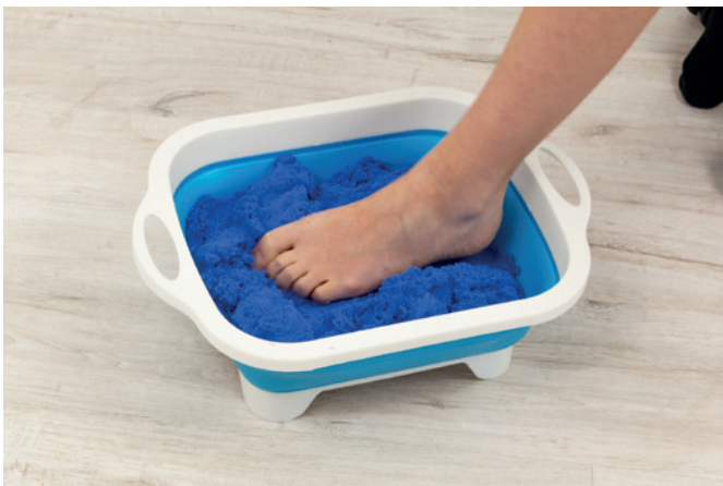
Sandrieseln / Greifkraft mit Zehen 01