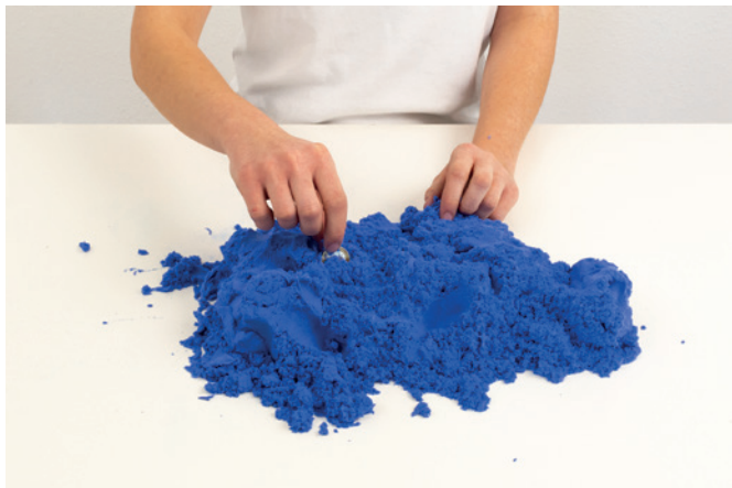
Münze finden und greifen

Weitere Übungen sind je nach therapeutischer Anweisung möglich.