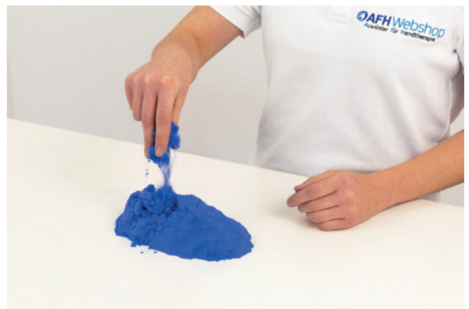
3-Punkt Griff 02