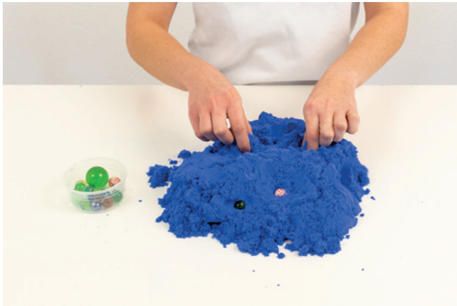
Murmeln finden 01

Weitere Übungen sind je nach therapeutischer Anweisung möglich.