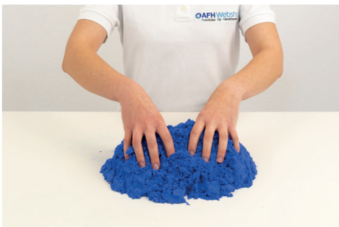
Sandrieseln bilateral 01