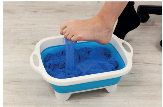
Sandrieseln / Greifkraft mit Zehen 02