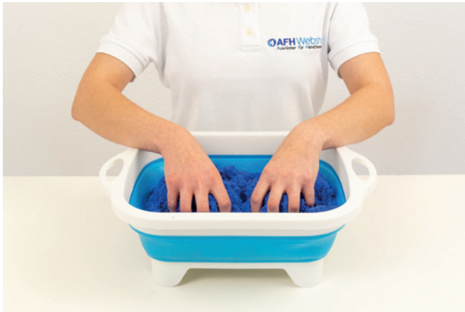
Sandrieseln bilateral mit Wanne 01

Weitere Übungen sind je nach therapeutischer Anweisung möglich.