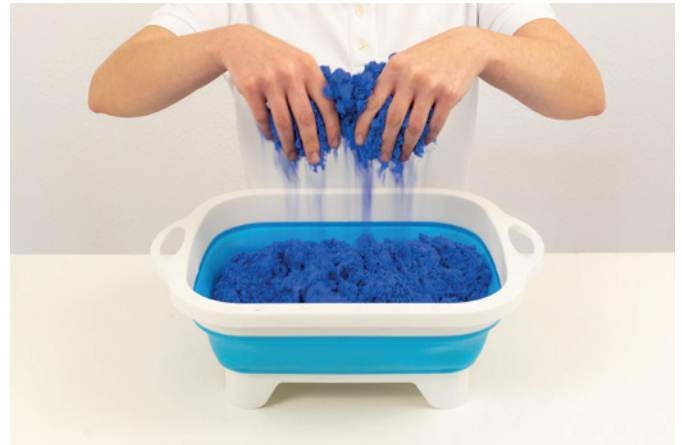
Sandrieseln bilateral mit Wanne 02