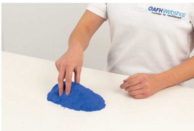
3-Punkt Griff 01