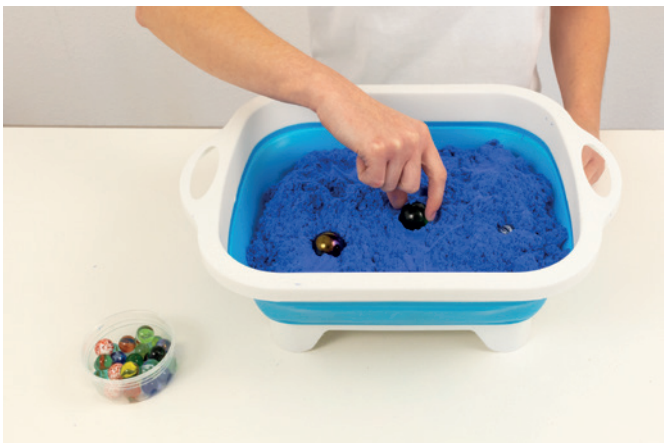
Murmeln finden mit Wanne 01