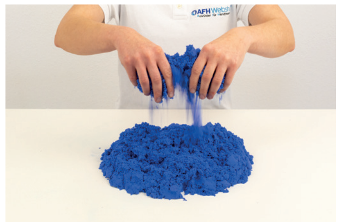
Sandrieseln bilateral 02