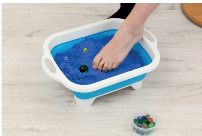
Murmel finden /greifen mit Zehen 01