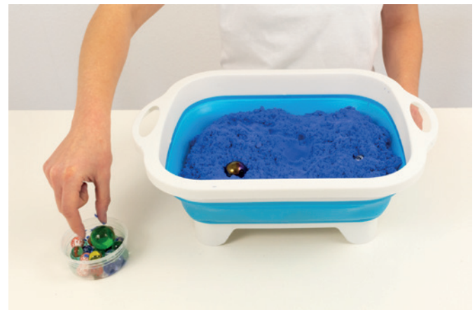
Murmeln finden mit Wanne 02