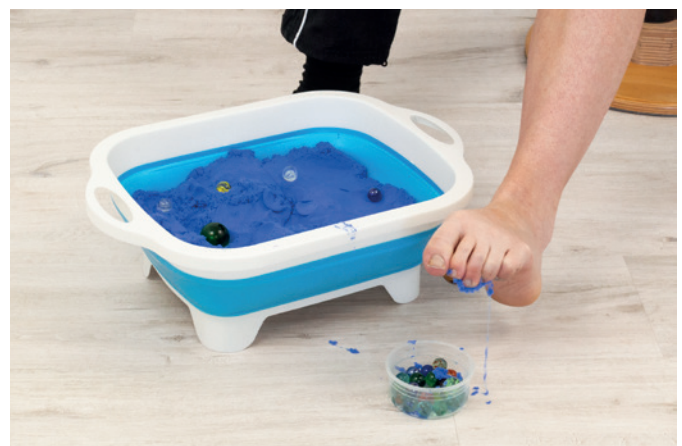
Murmel finden /greifen mit Zehen 01